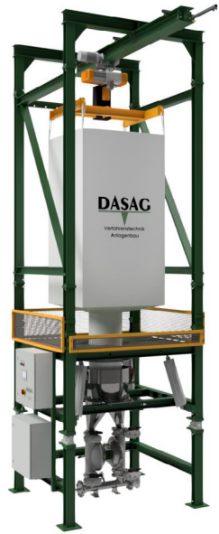
BIG BAG-Dosierstation mit DASAG-Pulverpumpe